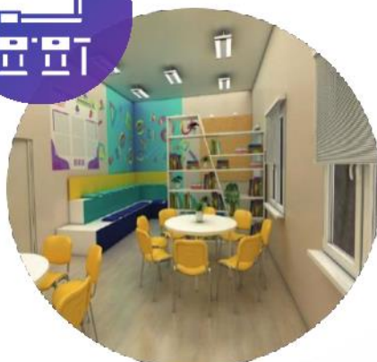
ЦЕНТРЫ ДЕТСКИХ ИНИЦИАТИВ