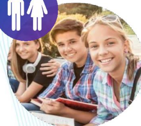
ПЕРВИЧНЫЕ ОТДЕЛЕНИЯ РДМ