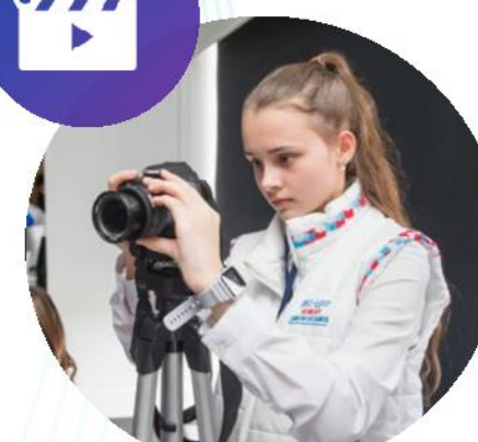
МЕДИА ЦЕНТРЫ КИНОКЛУБЫ