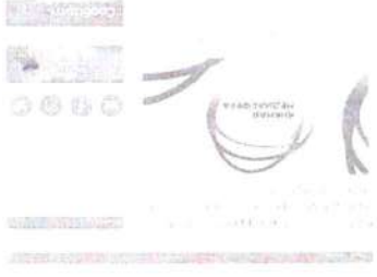
Рисунок 9 – Информация о предстоящем мероприятии

Данный пункт можно проиллюстрировать мероприятием – «Крутой стол «Как корректно писать о терроризме», который прошел в рамках форума «Ожюная медиафера» (см рисунок 9).