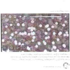
Рисунок 8 – Информация о прошедшем мероприятии в социальной сети «ВКонтакте»

Видеоаттракцион как один из результатов состоявшейся акции был распространен через отдаленную публикацию (см. рисунок 8).