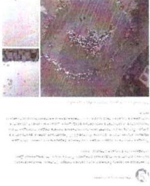
Рисунок 6 – Информация о предстоящем мероприятии в социальной сети «ВКонтакте»

Иллюстративным примером можно привести акцию памяти «Годы мира», проведенную Ростовградцентром в 2017 году. В сети Интернет была размещена анонсирующая информация (см. рисунок 6).