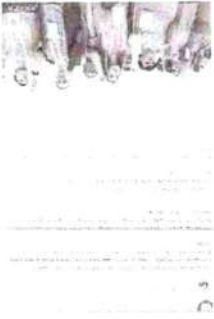
Рисунок 7 – Информация о прошедшем мероприятии в социальной сети «ВКонтакте»

В день организации акции была опубликована информация о том, что мероприятие состоится (см. рисунок 7). Стоит отметить привлечение дружественных сообществ в социальной сети к содействию в распространении публикации.