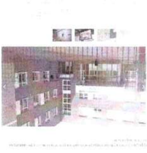
Рисунок 11 – Информашка о прошедшем мероприятии

Другой пример – мероприятие по мониторингу обеспечения антитеррористической безопасности объектов массового пребывания в г. Барнаул (см. рисунок 11).