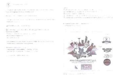
Рисунок 1 – Анонс мероприятия в социальной сети

В анонсе должна содержаться информация, разъясняющая что, где, когда и кем проводится. Данные могут предоставляться дозированно, обязательный элемент – наличие прямых контактов организаторов (см. рисунок 1).