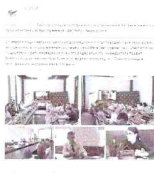
Рисунок 12 – Информация о прошедшем мероприятии