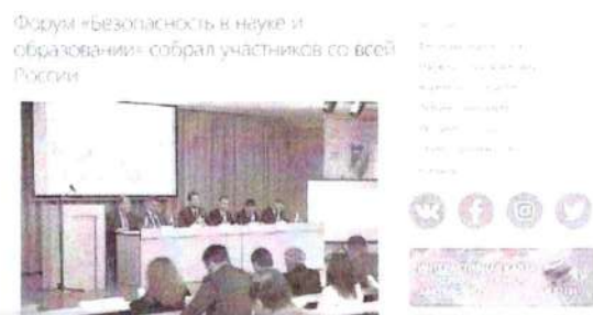
Рисунок 5 – Заключительный пресс-релиз

Заключительный пресс-релиз представляет собой отчет (или репортаж) с прошедшего мероприятия, включает комментарии участника о прошедшем событии, сопровождается фото, видео или аудиоматериалами (см. рисунок 5).