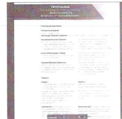
Рисунок 3 – Программа Форума, включенная в подробный пресс-релиз о мероприятии

Подробный пресс-релиз включает в себя информационное сообщение, программу мероприятия с акцентированием конкретных событий, чтобы представители медиа могли ориентироваться в происходящем на мероприятии. Обязательный элемент – представление спикеров мероприятий, основных участников (см. рисунок 3).