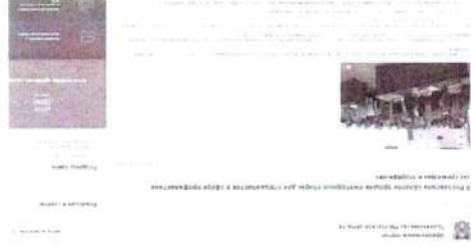
Рисунок 10 – Информашка о прошедшем мероприятии

Иллюстрацией информационного освещения мероприятий такого рода являются проведение ежегодных сборов для специалистов, организованных Антитеррористической комиссией Ростовской области. В новостной публикации сообщается, что ключевой темой встречи было обсуждение принятого Комплексного плана–2023, также в программу сборов вошли лекции представителей силовых ведомств, регионального министерства образования и департамента по борьбе с терроризмом (см. рисунок 10).