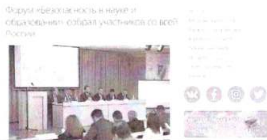
Рисунок 5 – Заключительный пресс-релиз

Заключительный пресс-релиз представляет собой отчет (или репортаж) с прошедшего мероприятия, включает комментарии участника о прошедшем событии, сопровождается фото, видео или аудиоматериалами (см. рисунок 5).