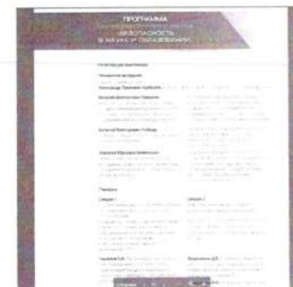
Рисунок 3 – Программа Форума, включенная в подробный пресс-релиз о мероприятии

Подробный пресс-релиз включает в себя информационное сообщение, программу мероприятия с акцентированием конкретных событий, чтобы представители медиа могли ориентироваться в происходящем на мероприятии. Обязательный элемент – представление спикеров мероприятий, основных участников (см. рисунок 3).