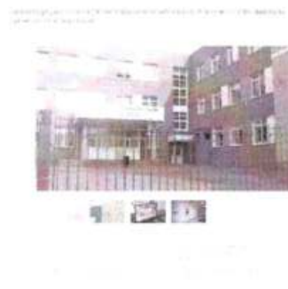
Рисунок 11 – Информация о прошедшем мероприятии

Другой пример – мероприятие по мониторингу обеспечения антитеррористической безопасности объектов массового пребывания в г. Барнаул (см. рисунок 11).