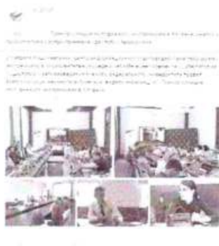
Рисунок 12 – Информация о прошедшем мероприятии