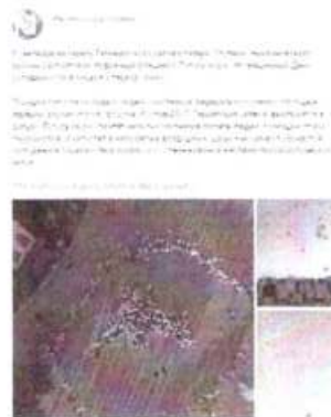
Рисунок 6 – Информация о предстоящем мероприятии в социальной сети «ВКонтакте»

Иллюстративным примером можно привести акцию памяти «Голубь мира», проведенную Ростовпатриотцентром в 2017 году. В сети Интернет была размещена анонсирующая информация (см. рисунок 6).