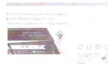
Рисунок 2 – Краткий пресс-релиз

Краткий пресс-релиз обычно содержит информацию с приглашением посетить мероприятие, зарегистрироваться или получить аккредитацию для представителей СМИ. Пример размещенного пресс-релиза продемонстрирован на рисунке 2.