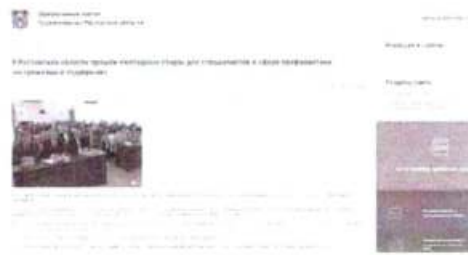
Рисунок 10 – Информация о прошедшем мероприятии

Иллюстрацией информационного освещения мероприятий такого рода является проведение ежегодных сборов для специалистов, организованных Антитеррористической комиссией Ростовской области. В новостной публикации сообщается, что ключевой темой встречи было обсуждение принятого Комплексного плана–2023, также в программу сборов входили лекции представителей силовых ведомств, регионального министерства образования и департамента потребительского (см. рисунок 10).