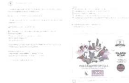
Рисунок 1 – Анонс мероприятия в социальной сети

В анонсе должна содержаться информация, разъясняющая что, где, когда и кем проводится. Данные могут предоставляться дозированно, обязательный элемент – наличие прямых контактов организаторов (см. рисунок 1).