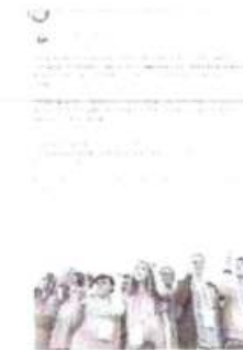
Рисунок 7 – Информация о проходящем мероприятии в социальной сети «ВКонтакте»

В день организации акции была опубликована информация о том, что мероприятие состоялось (см. рисунок 7). Стоит отметить привлечение дружественных сообществ в социальной сети к содействию в распространении публикации.