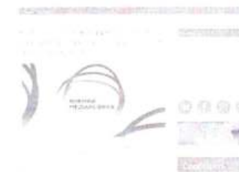
Рисунок 9 – Информация о предстоящем мероприятии

Данный пункт можно проиллюстрировать мероприятием – Круглый стол «Как корректно писать о терроризме», который прошел в рамках форума «Южная медиафера» (см рисунок 9).