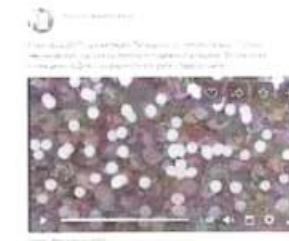
Рисунок 8 – Информация о прошедшем мероприятии в социальной сети «ВКонтакте»

Видеоматериал как один из результатов состоявшейся акции был распространен через отдельную публикацию (см. рисунок 8).